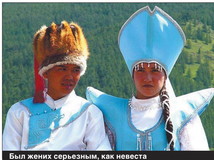
Был жених серьезным, как невеста

На что же уходят «свадебные» деньги? На спиртное, например. Существует у алтайцев обычай своеоб-