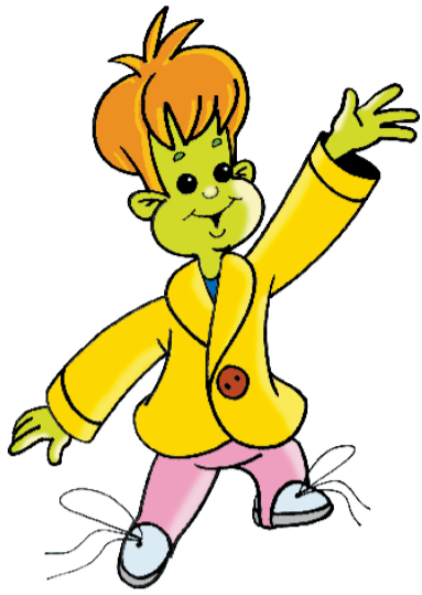
Von Swetlana Gaus

Bald ist Ostern. Schrumdi will viele bunte Eier haben. Er geht in den Hof. Dort ist ein Huhn.